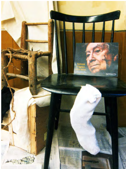
Treballs del alumnes del Taller Carrau Blau, Antoni Tàpies