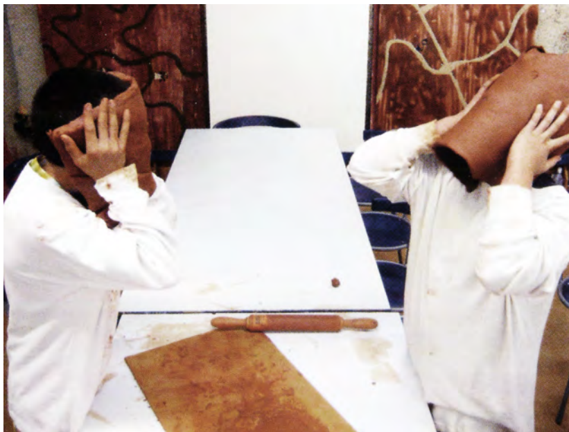
Treballs del alumnes del Taller Carrrau Blau, Miquel Barceló