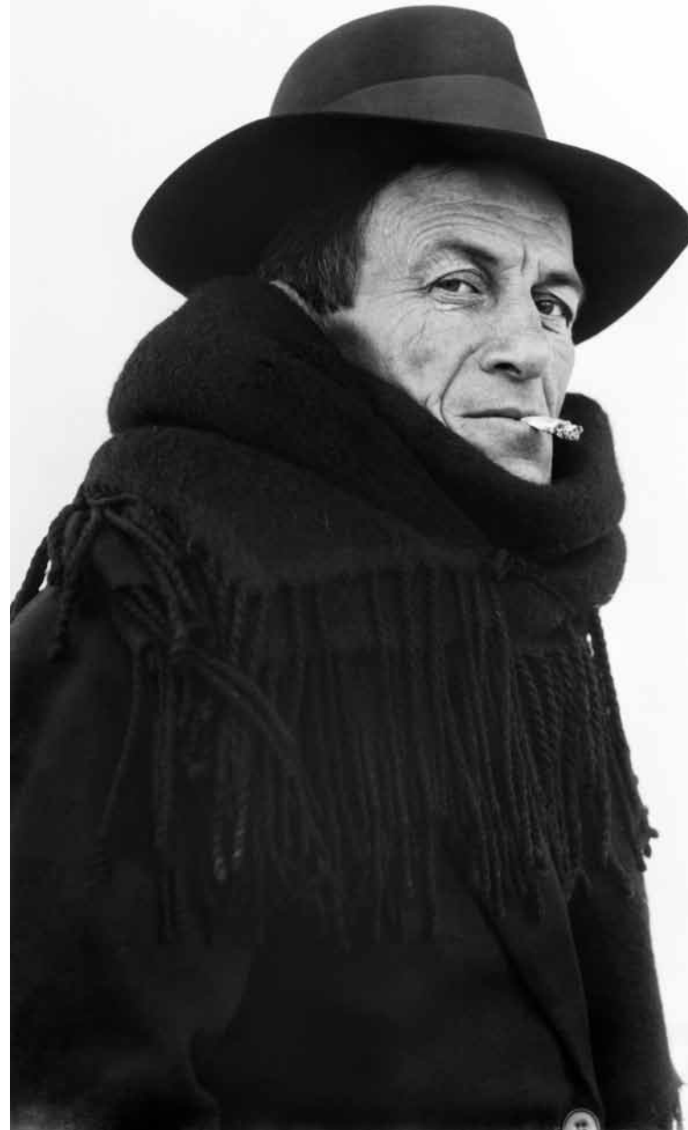
Mario de Bucovich Eivissa / Ibiza 1932 Museu de Mallorca, Palma