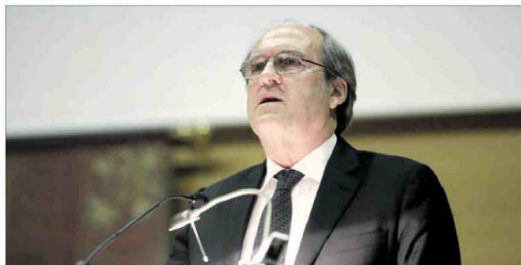
Imágenes del multitudinario homenaje a la rectora, en el que hubo distintas intervenciones, incluyendo la de Gabilondo, y la actuación de la Coral Universitaria. M.MIELNIEZUK