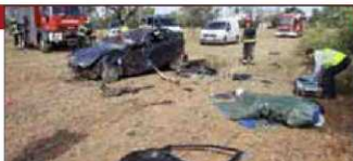
El coche volcó tras entrar en una finca.

Hallan a un conductor muerto tras accidentarse en la vía Lluçmajor-Campos •Páginas 11y 12