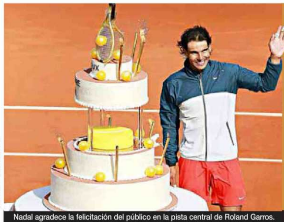
Nadal agradece la felicitación del público en la pista central de Roland Garros.

DEPORTES • Pág. 48 Rafael Nadal se regala los cuartos de final de Roland Garros