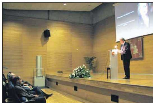
Sembra d'un arbre i acte acadèmic al campus, celebrats dilluns. UIB