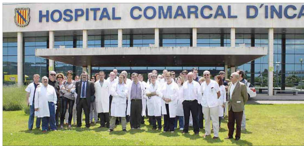
Los profesionales sanitarios, ayer en el Hospital de Inca tras la asamblea convocada por el Sindicato Médico de Balears.