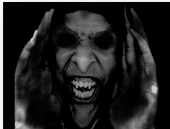
Figura 2. Exemple d'imatges emprades com a primes afectius en l'experiment

Els resultats obtinguts varen ser semblants als del segon estudi. El priming afectiu emprant imatges d'horror va reduir exclusivament la severitat dels judicis morals, sense produir cap efecte sobre els judicis no morals. A més, com havia succeït en els experiments anteriors, la potència de l'efecte va ser més gran en els temps d'exposició més breus. Així doncs, quan el temps d'exposició va ser extremadament curt (20 ms), l'efecte del prime va induir més permissivitat en els judicis morals que quan es va emprar un temps d'exposició més prolongat (250 ms).