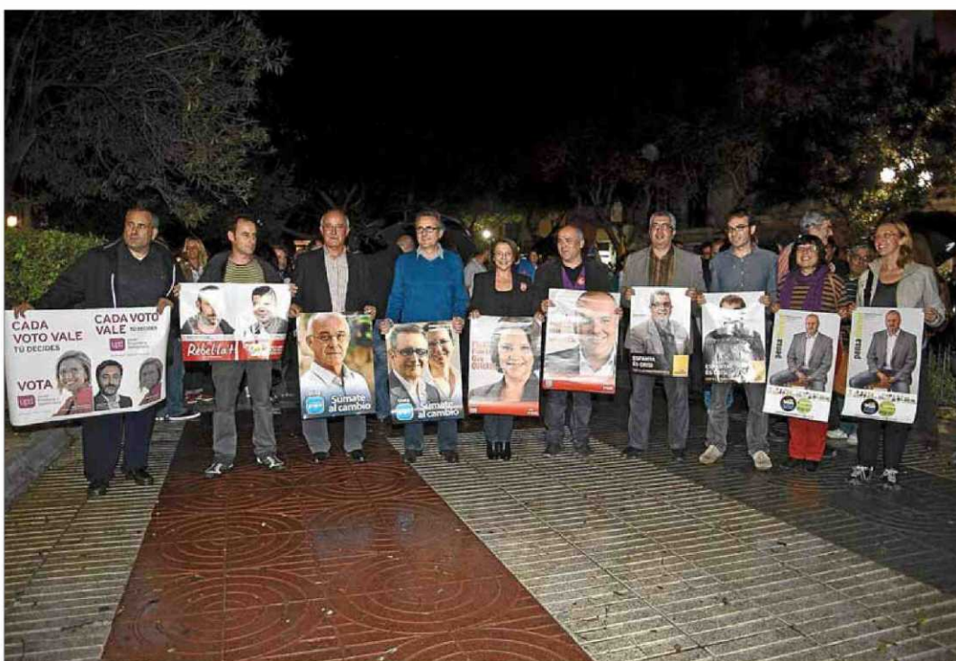
Los candidatos pitiusos durante la pegada de carteles, ayer, en Vara de Rey.

La recuperación está siendo «muy débil» y «difícilmente» las is-