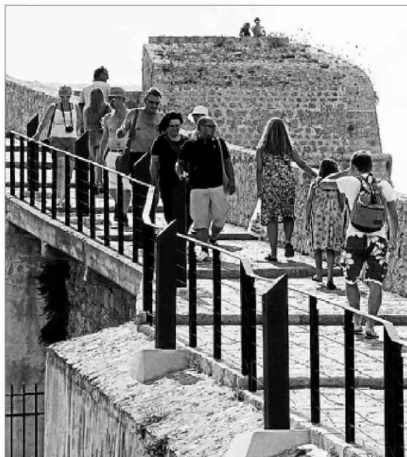
Turistas paseando por Dalt Vila. JOAN LLUÍS FERRER

En el caso del sector industrial, el descenso ha sido del 0,8% y del 0,9% en esos segundo y tercer trimestre, en opinión del CRE, y del 1,5% en el segundo, según el Ejecutivo balear.