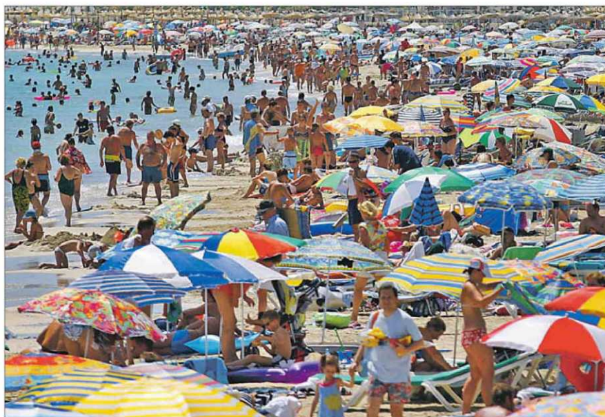
Govern y CRE coinciden a la hora de hablar de una excelente temporada estival. S. LLOMPART

La buena noticia es que el director del CRE opina que por el momento la economía del archipiélago no está en peligro de volver a tasas negativas y de entrar de nuevo en recesión, pese a existir el riesgo de que los débiles aumentos y la crisis se prolonguen en el tiempo si no se hacen los cambios necesarios