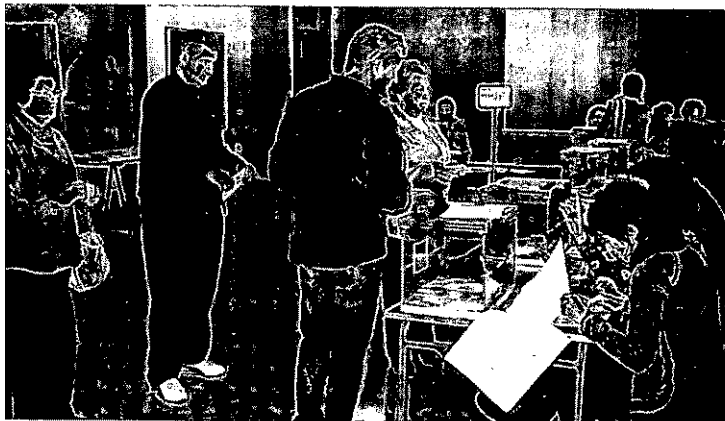
COLEGIO ELECTORAL EN MANACOR. Unos ciudadanos esperan para votar.

tantes de las regiones que lindan con el mar tienden menos a participar en los comicios y, además, está comprobado que cuanto más distancia hay del centro político de la nación menos se acude a votar. Esto conecta con el aspecto socioeconómico ya que las regiones de litoral viven del turismo y esto genera un estilo de vida con un exceso de oferta de ocio.