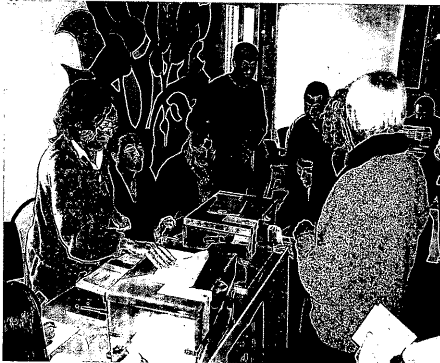
COLEGIO ELECTORAL EN IBIZA. Una de las zonas que menos vota.

Por islas, en Mallorca se registró a esa hora una participación del 51,37%, lo que sitúa a la isla un 5,61% por debajo de la participación registrada a la misma hora en las elecciones de 2008, cuando había votado el 56,98%. En Menorca, la participación alcanzó a las 18.18 horas el 48,07%, un 5,31% menos que en los comicios generales de 2008 a la misma hora, cuando había