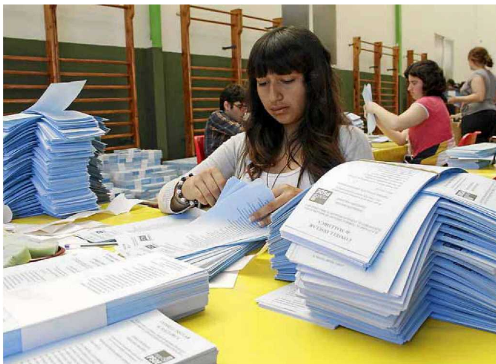
Una al·lota prepara les paperetes de les darreres eleccions autonòmiques i municipals a Palma.