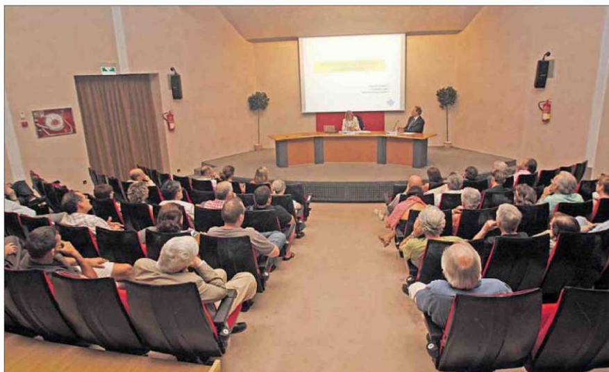
El público escuchó atentamente la conferencia de la rectora de la UIB.

"Es cierto que el mundo universitario tiene sus deficiencias, pero también es cierto que si las