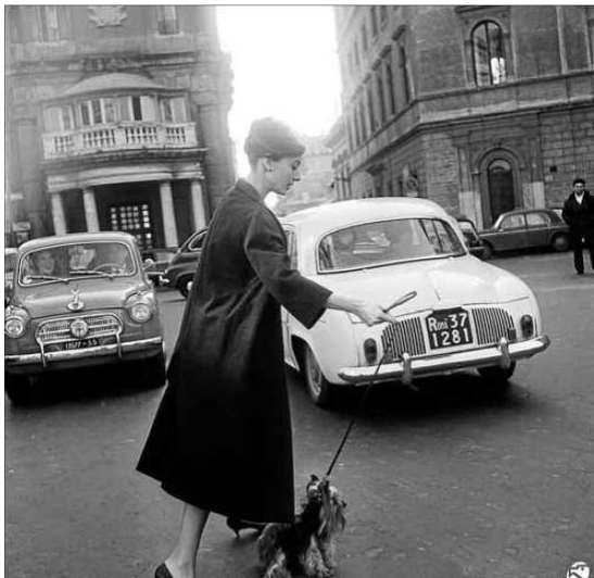
Audrey Hepburn paseando un perro por las calles de Roma.