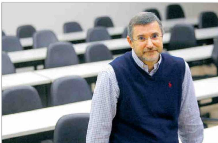
“La revista pretén potenciar la innovació i la recerca”. M. MIELNIEZUK

■ A tota la comunitat educativa, però el seu caire didàctic i científic fa que sigui una revista especialment útil per als professionals de l'educació. També pot ser molt útil per als pares i les mares i per a