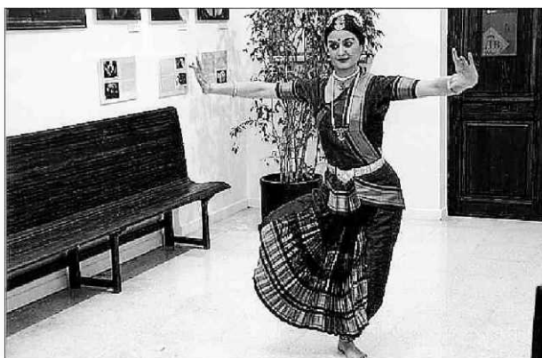
Imagen de una muestra de baile indio en la UIB.