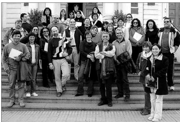
La cooperació universitària arriba a America Llatina, Àfrica i Àsia. A la imatge, Argentina.