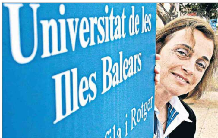
La rectora lleva dos años tras este sello y lo ve cada día más cerca.

Este curso la UIB presentó al Ministerio el 'Campus Internacional de Sostenibilidad Turística e Investigación Avanzada', apoyándose en dos puntos. El primer pilar se basa en, partiendo del perfil turístico de nuestra comunidad, los beneficios que tendría para la sociedad balear que la Univer-