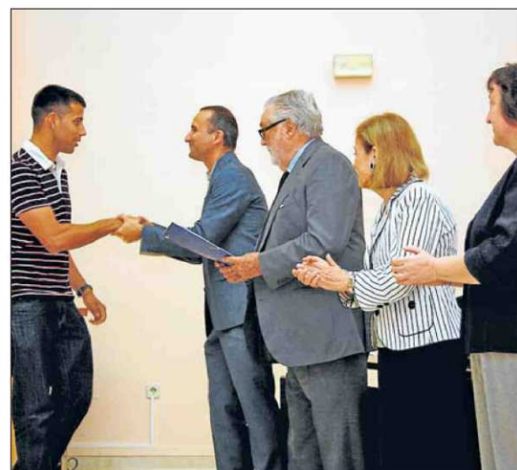
Otro de los alumnos premiados recibiendo el reconocimiento.